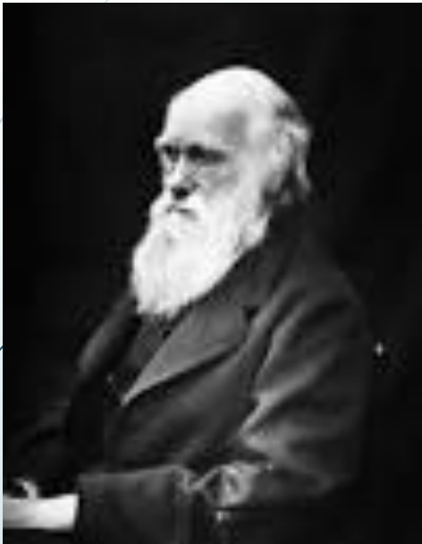
ชาลส์ โรเบิร์ต ดาร์วิน